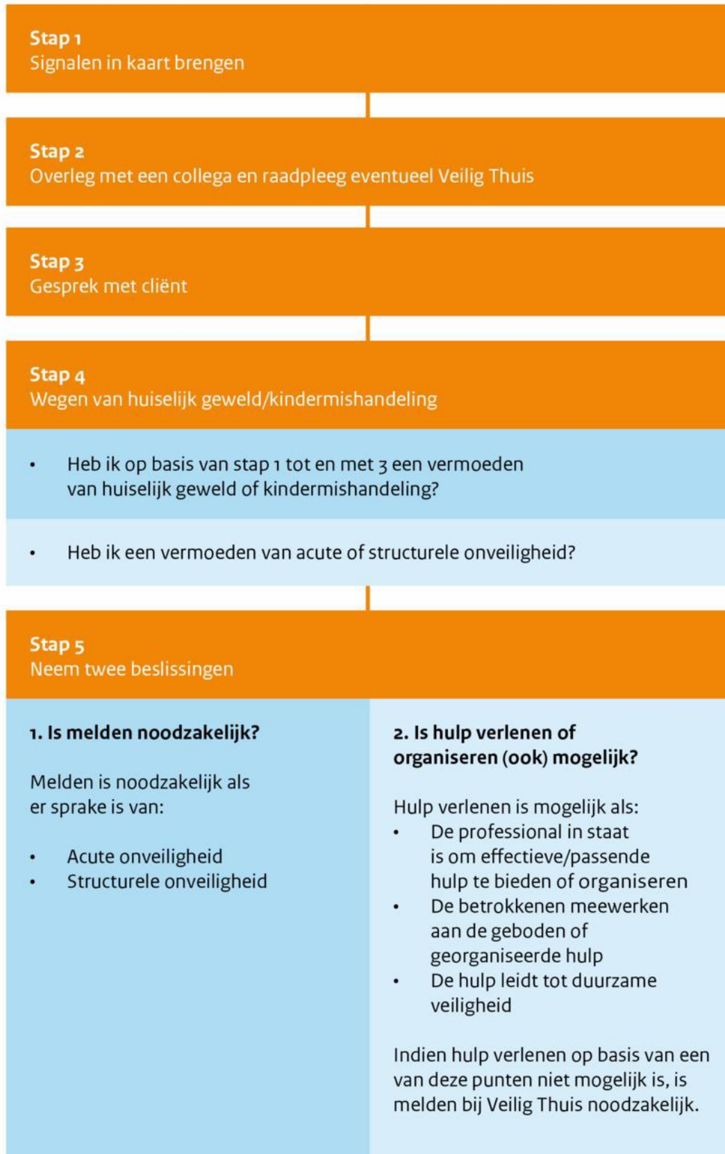
Figuur 1: Stappenplan verbeterde meldcode